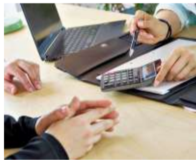
Zugewinne müssen genau berechnet werden.

Haben indes beide Eheleute oder einer von ihnen erheblich Vermögen hinzugewonnen, kann sich ein Zugewinnausgleich für einen der Partner rechnen. Vermögen, das in Frage kommt, können zum Beispiel Aktiendepots, Versicherungen, Schmuck oder Bankguthaben sein.